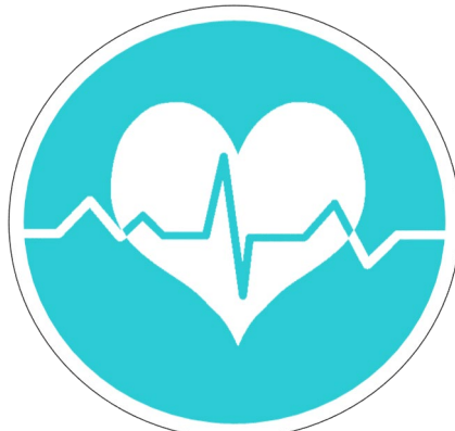
โรคไม่ติดต่อ