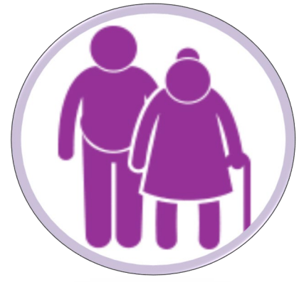
ผู้สูงอายุ