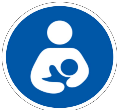
สุขภาวะแม่