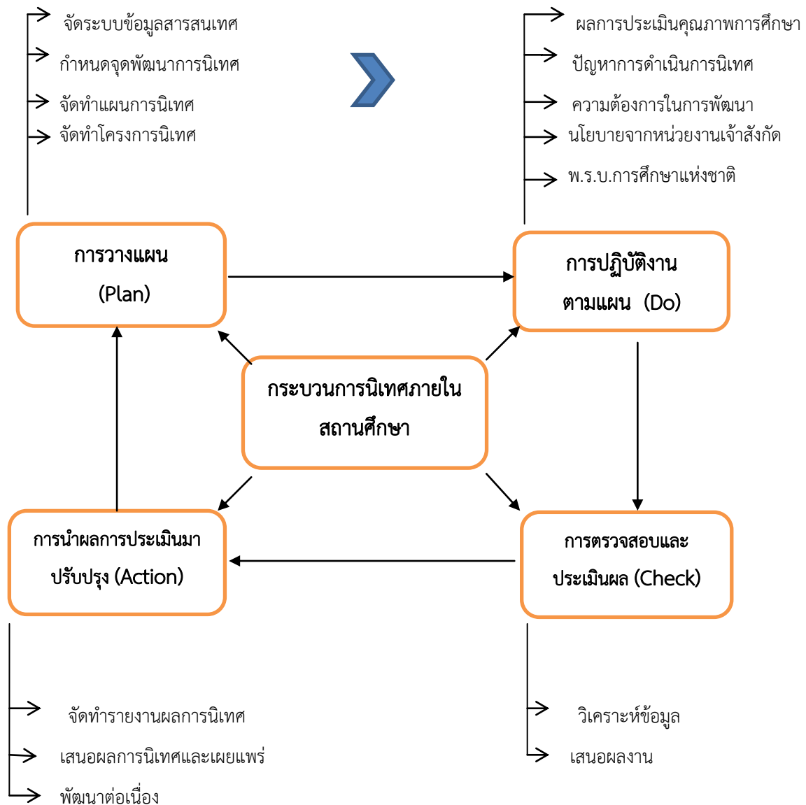
แผนภูมิกระบวนการนิเทศการศึกษาด้วยวงจรคุณภาพ (PDCA)